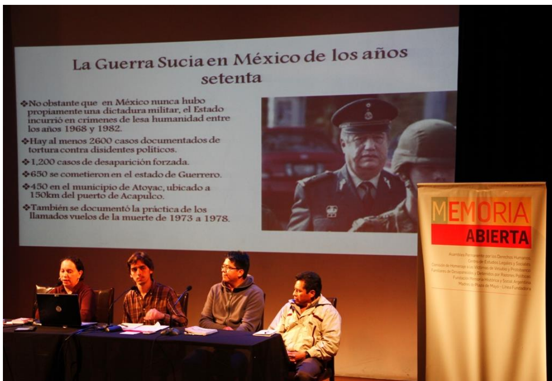
Sitios de México presentando su caso sobre la represión en el Estado de Guerrero