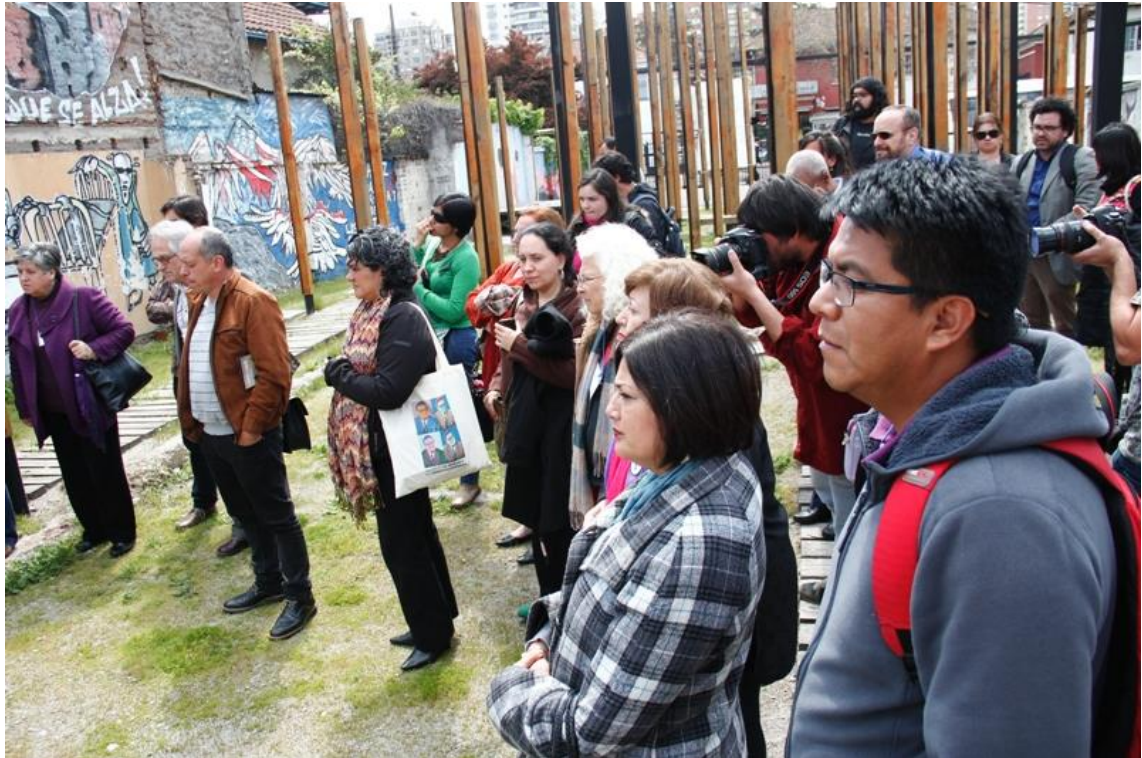
La Red de Sitios de Memoria en José Domingo Cañas

Durante la tarde, la Red Latinoamericana visitó el sitio Estadio Nacional, sobrevivientes explicaron el funcionamiento del Centro Clandestino, el proceso de recuperación y los espacios que funcionan como sitio de Memoria en el complejo municipal.