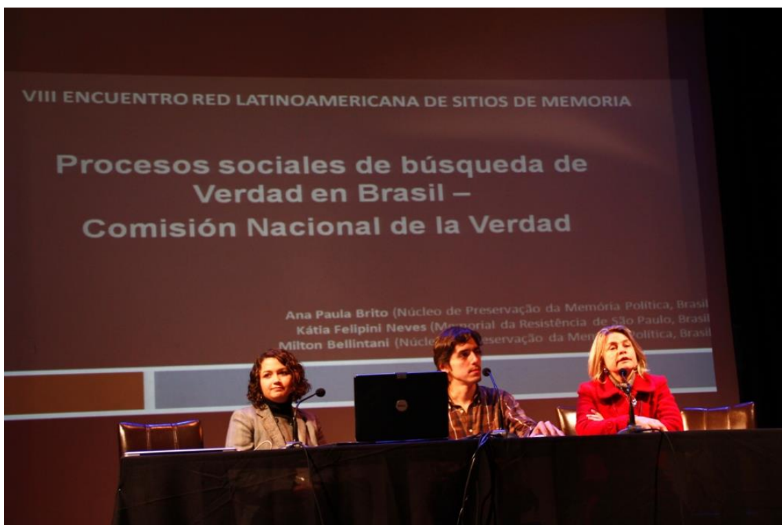
Presentación sobre la Comisión Nacional de Verdad, resultado del trabajo de los Sitios de Brasil