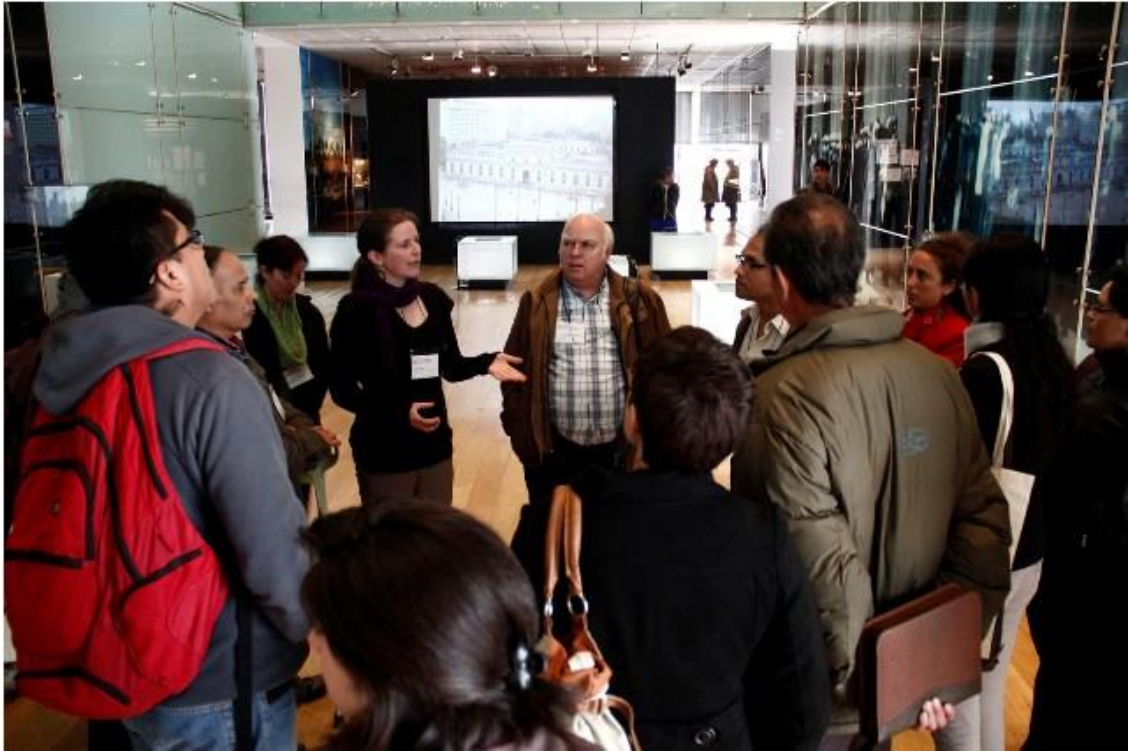
Visita guiada en el Museo de la Memoria y los DDHH

Posteriormente los sitios de América Latina visitaron el Parque por la Paz Villa Grimaldi, en donde se realizó una visita guiada.