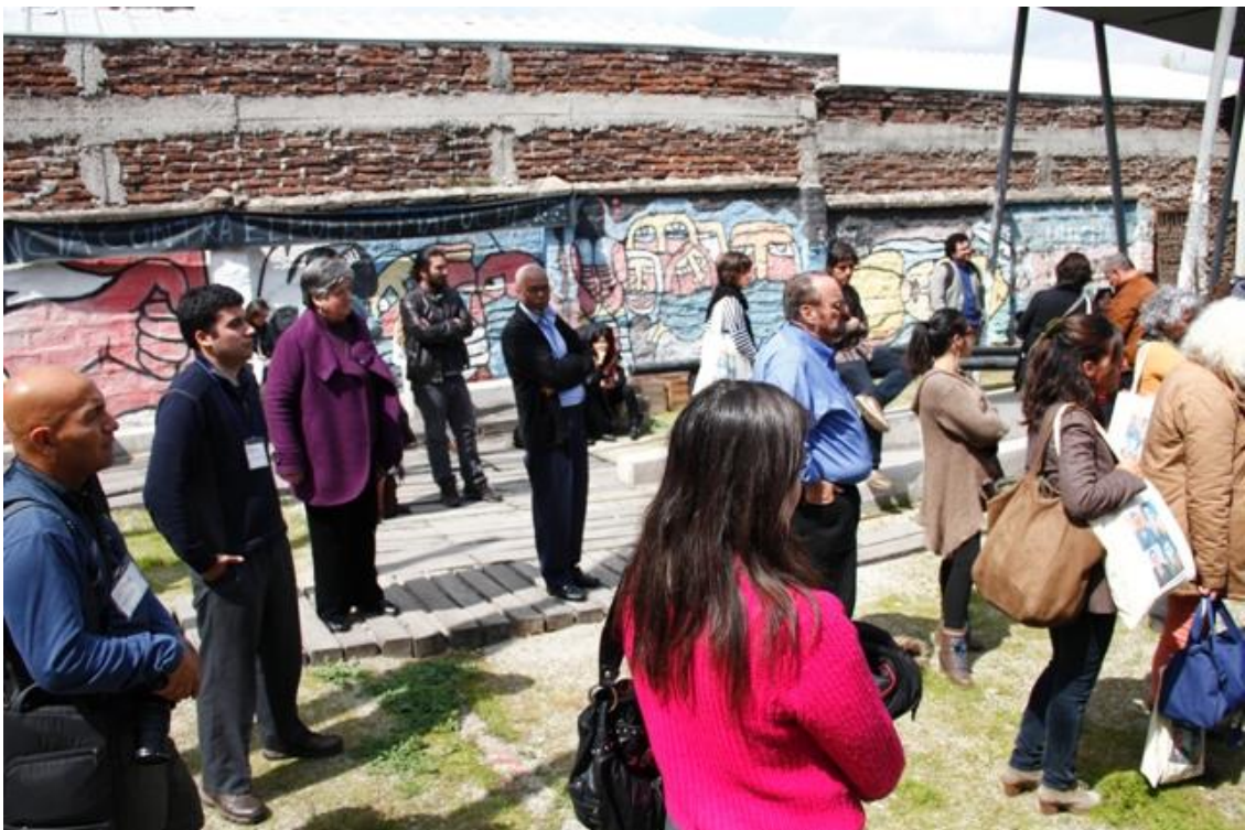
La Red de Sitios de Memoria en José Domingo Cañas