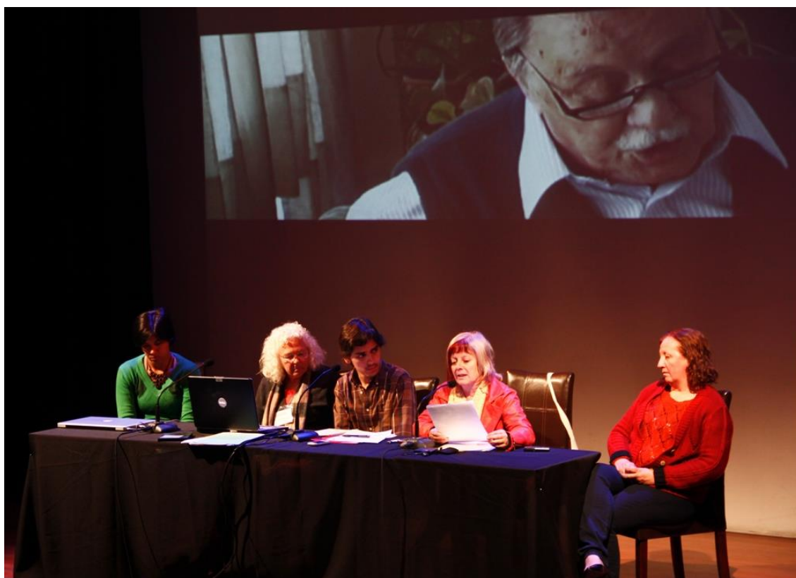
Las compañeras de Uruguay presentando su caso sobre las Marchas del Silencio

Se presentó en plenario, materiales, fotos y videos sobre cada uno de los casos.